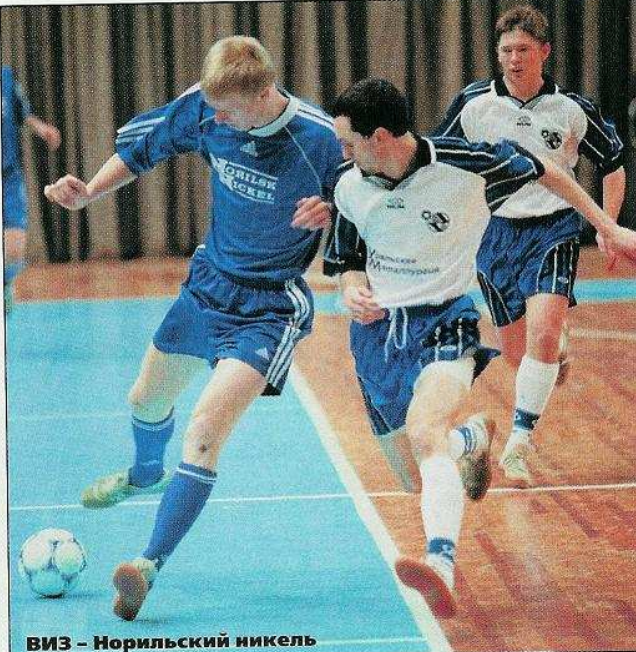
ВИЗ – Норильский никель